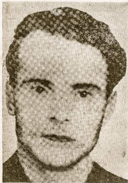
S. Kudirka — laisvas.

Academijoje dalyvavo liet. draugas JAV kongreso atstovas E. Derwinkis, daug padėjęs Simo išlaisvinimo reikale. Savo kalboje jis iškėlė S. Kudirką kaip lietuvių tautos laimėjimo ir laisvės kovų simbolį. Simo atvykimas rodo, kad lietuvių tauta nėra nugalėta ir tebėra sveika ir gyva. Kongresmanas kalbėjo apie prezidentą G.