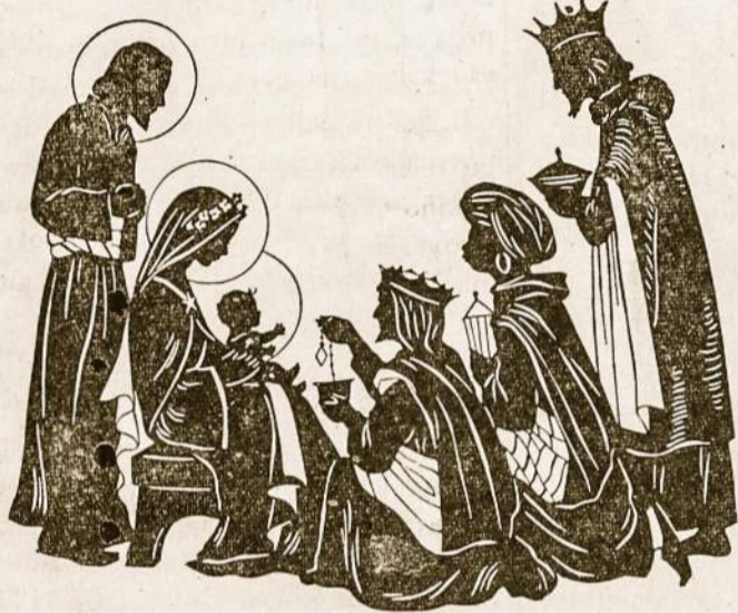
Su Kristaus gimimu — taika ir ramybė teateina į mūsų širdis.

O Šv. Jonas Evangelistas dar aiškiau nupasakoja žmonijos tragediją: "Jis atėjo pas savuosius, bet savieji jo