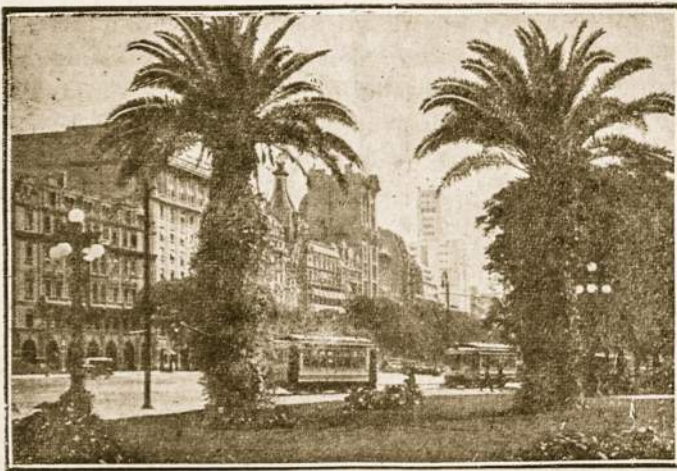
Didmiesčio palmės suteikia grožio ir pavėsio.

Centre, Sarmiento 1500. Vestibulio patalpinta lenta visados pilna skelbimų apie sekančius kongresus artimiausiais mėnesiais.