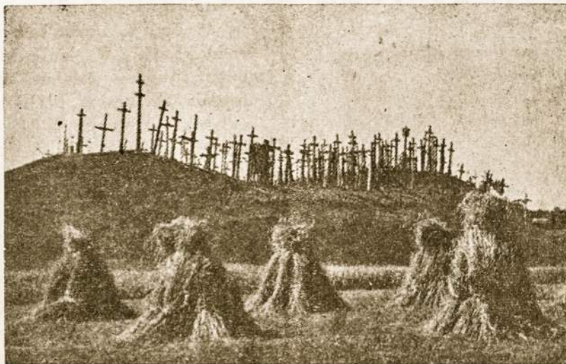
Meškuičių piliakalnis, vadinamas Kryžių kalnu — taip jis seniau atrodė. Sovietinė valdžia kryžius sunaikino, tačiau jie ir vėl atsiranda ant kalno.

šią kelionę. Saugumiečiai visą naktį važinėjo maršrutu: Šiauliai — Kryžių kalnas. Kryžiaus nešėjams pasisekusi kelionė atrodė kaip stebuklas. 1973 gegužės 20 d. 2 val. 30 min. Kryžių kalnas pasipuošė nauju, gražiu kryžiumi. Aplink jį pasodinta gėlių ir uždegta žvakė. Visi suklaupę meldėsi: "Kristau Karaliau, teateinie Tavo karalystė į mūsų šalį".