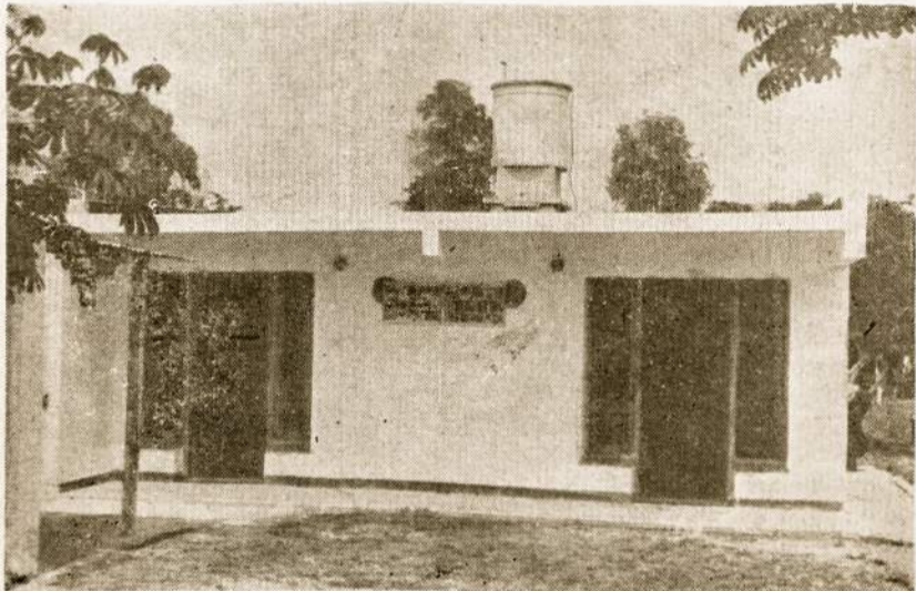
Vienas iš S. Židinio namelių turintis du butukus. Tokių namelių dygsta kas kart vis daugiau, kūriasi pensininkų vietovė.

Šiandieną Liet. Senelių Židinyje galima jau pasidžiaugti 8-niais gyvenamais butais, kuriuose gyvena senesnio amžiaus lietuviai — moterys ir vyrai. Jau visai baigiami įrengti kiti du butai Nr. 9 ir 10 (jų atidarymas numatytas kovo mėn.).