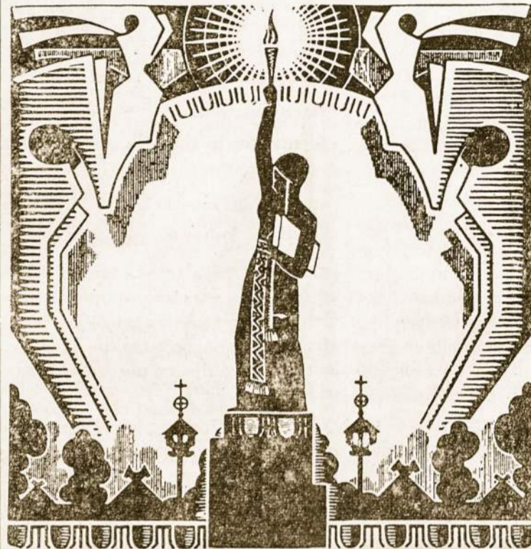
Laisvės Lietuvai ir pasaulio teisingumo!