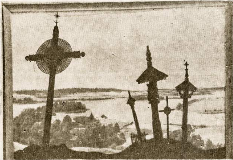
Lietuva — kryžių šalis. Pasitikėjimas kryžiumi ją stiprina ir dabartinėje kovoje su okupantu.

nuo viduramžių, kai kryžiuočių ordonas pradėjo kardu "krikštyti" Lietuvą, ją išjudino iš ramaus gyvenimo ir privertė apsiginti ir susijungti.