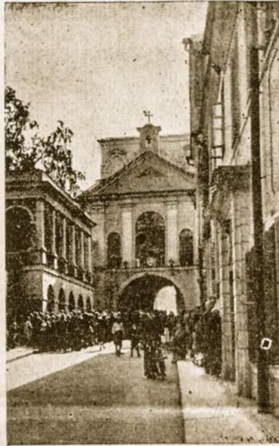
Aušros Vartai Vilniuje lietuvių mėgiama peligrinacijos vieta.

Todėl nesvarbu kokių būdu kelionė atliekama: peščias, su arkliu ar autobusu, bei lėktuvu, svarbu su kokia intencija ši kelionė yra atliekama, kad ji būtų tikrai gryna ir dvasinė. Ne daug padės atlikti maldingą kelionę, jei mes norėsime tikrai pasivežinėti,