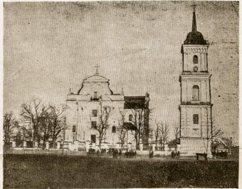
Troškūnų bažnyčia - poeto Kaz. Inčiūros tėviškė.