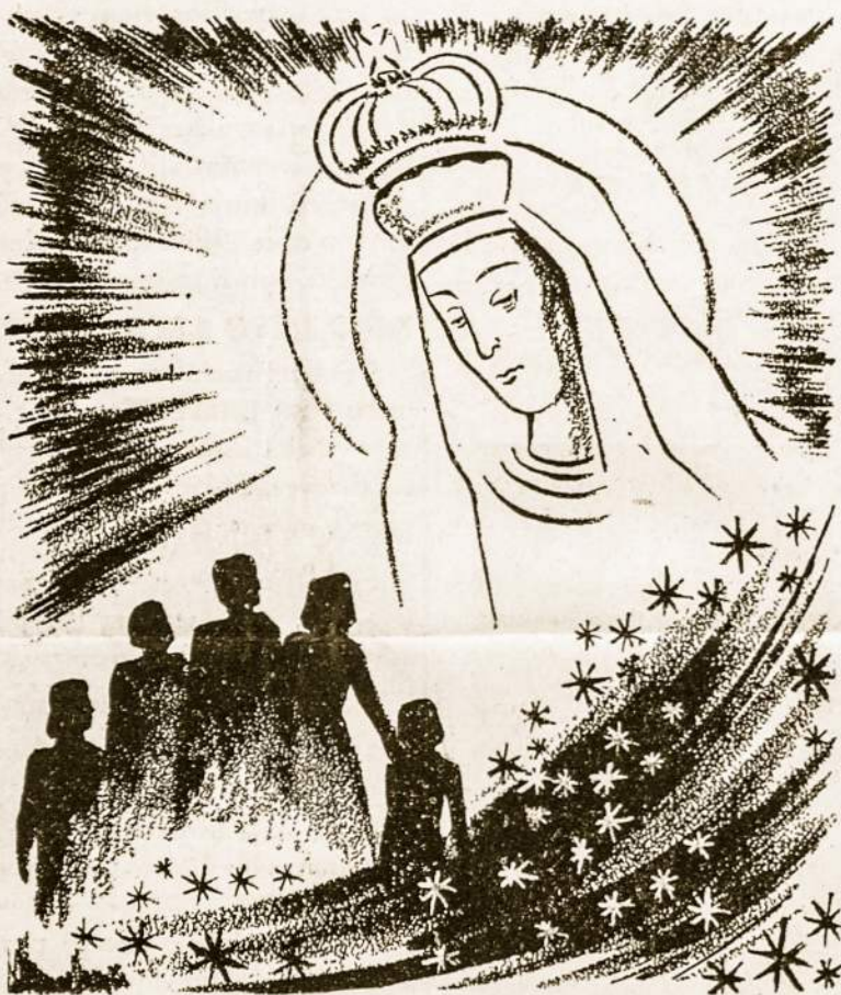
Marija vadovauk mūsų kelionei ant žemės!

Kadangi Šv. Mišios turi Dievo Žodžio liturgiją-skaitymus, aukojimą,