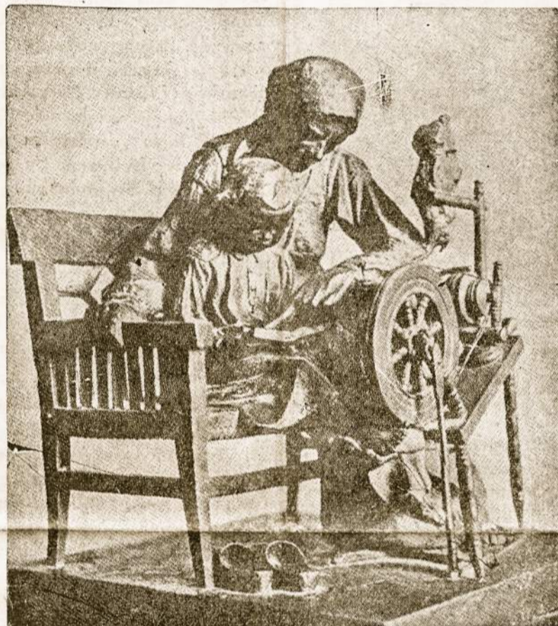
Vargu mokykla, lietuviškos kultūrinės kovos simbolis caro ir vysk. M. Valančiaus laikais.

Toliau šie drąsūs vyrai nurodo kelią į tikrą atgimimą skelbdami reikalą "išsilaisvinti ir apsisvalyti vidujiniai". Be šio vidinio atsinaujinimo, pagal jų