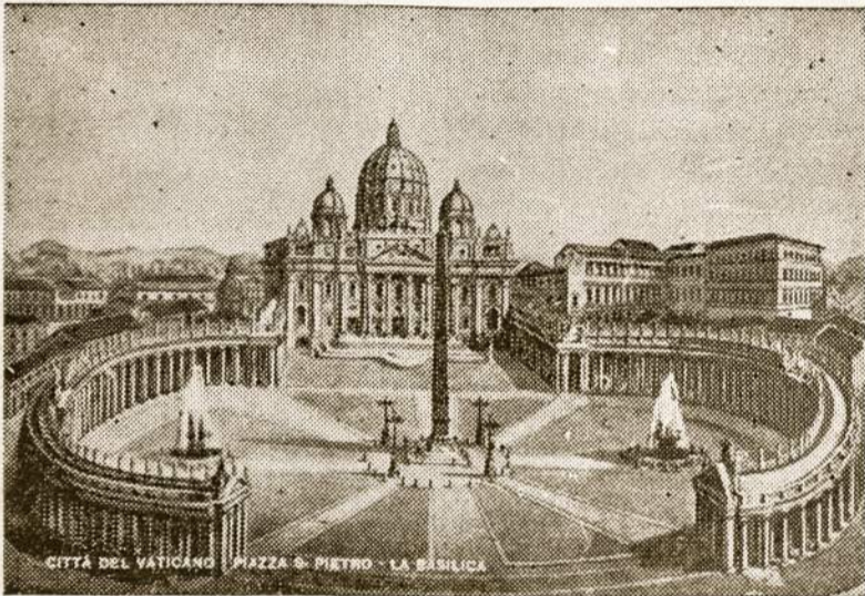
Vatikanas — Romoje — nuolatinė popiežių buveinė. Čia gyvena šv. Tėvas Povilas VI, dabartinis Kat. Bažnyčios valdytojas.

Mūsų laikais Šv. Petro vietoje Bažnyčią valdo popiežius Povilas VI, kuriam atitenka toji didelė atsakomybė: vadovauti šiai Dievo tautai, ją ginti nuo priešų puolimų, išlaikyti sveiką mokslą