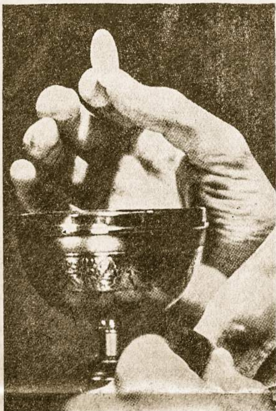
Eucharistija yra gyvoji duona, kuri malšina žmonių alkį.

• "Laisvosios žemės" kolūkyje (Biržų raj.), stovėjo du kryžiai. 1975 m. birželio mėn. apylinkės pirm. Striška pasamdė du vyrus, kurie kryžius nupiovė.