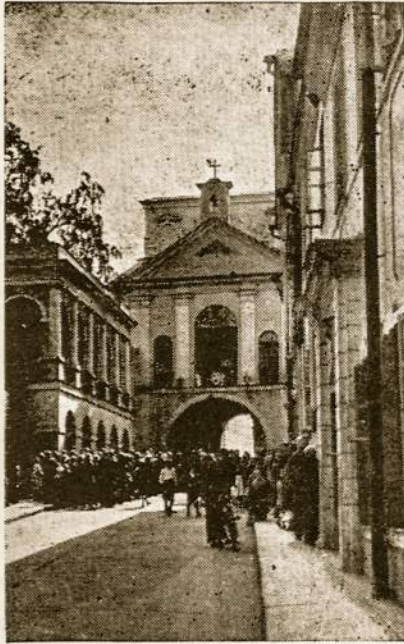
Aušros Vartai Vilniuje, lietuvių nuolatine dvasinio susikaupimo vieta.

Kai prieš savo kančią Kristus prašė apaštalu pasilikti su juo valandėlei ir pabudėti, jie užmigo ir paskui išbėgiojo iš baimės. Kai prieš žengdamas į dangų Kristus prašė apaštalu, kad jie budėtų ir meltųsi kartu, laukdami ateinant Šv. Dvasios, apaštalai išpildė šį mokytojo prašymą, pasilikę su Dievo Motina bendroje maldoje ir de-