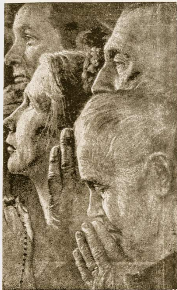
Bendra malda, bendras sutartas visuomeninis darbas — telydi mus per visą gyvenimą.

• Filadelfijoje vykstančiame Tarpt. Eucharistiniame Kongrese lietuviai labai aktyviai dalyvaus. Lietuvių sekcijos šūkis bus: "Lietuviai alksta žmogaus teisių" Kongrese laisvieji lietuviai atstovaus pavergtai Lietuvai.