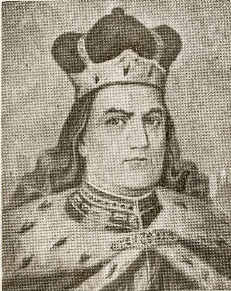
Lietuvos kunigaikštis Vytautas Didysis (1350-1430). Jo laikais Lietuva buvo viena iš didžiųjų Europos valstybių.

Lietuvoje ir visose lietuvių kolonijose užsienyje buvo minimi to karžygio darbai rengiamos parodos, sta-