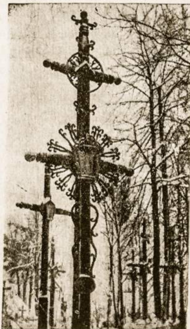
Lietuvos kapinių kampelis su tipingais lietuviškais kryžiais.

pinėse raudas. Vakare šeimoje buvo uždegama grabnyčia (grabo žvakė) ir visa šeima meldavosi už mirusius. Dzūkijoje žmonės atnešdavo į bažnyčią maisto, kaip pav. grikių pyrago ir padėdavo ant altoriaus, kad paskui būtų padalinta vargšams.