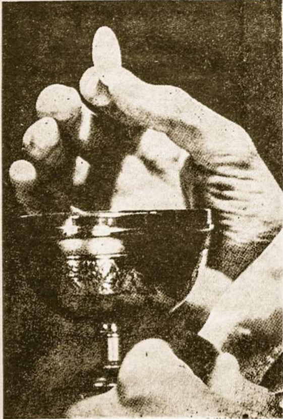
Velykinė Komunija — Kiekvieno Krikščionio pareiga.

Visi laukėme Velykų Švenčių. Per Velykas visi sveikinome, linkėdami vieni kitiems "linksmų ir laimingų švenčių", arba "su šventomis Velykomis". Velykų šventės jau praėjo, kaip ir visos šventės praeina labai greitai.