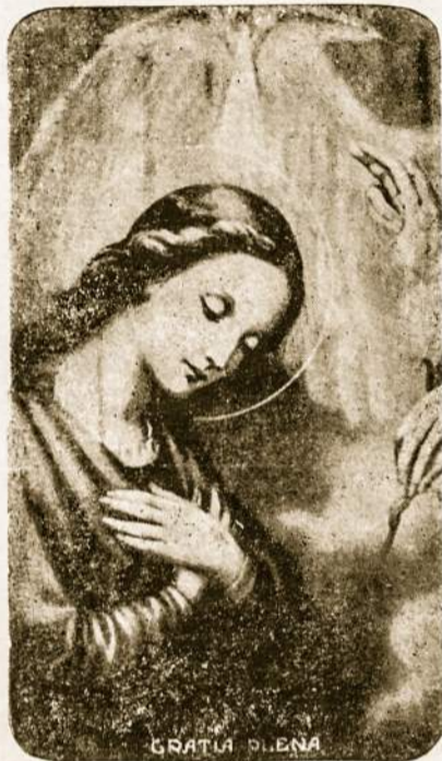
Marija geroji motina Išmokyk mus melstis!

Visas Marijos gyvenimas buvo surištas su jos sūnumi, Jėzumi. Ji nešiojo jį devynius mėnesius savo iščioje, vėliau lydėjo per visą jo žemišką gyvenimą iki Golgotos kalno, kur ji stovėdama po Kryžiumi aukojo savo Sūnų Dangiškajam Tėvui už žmonijos išganymą.