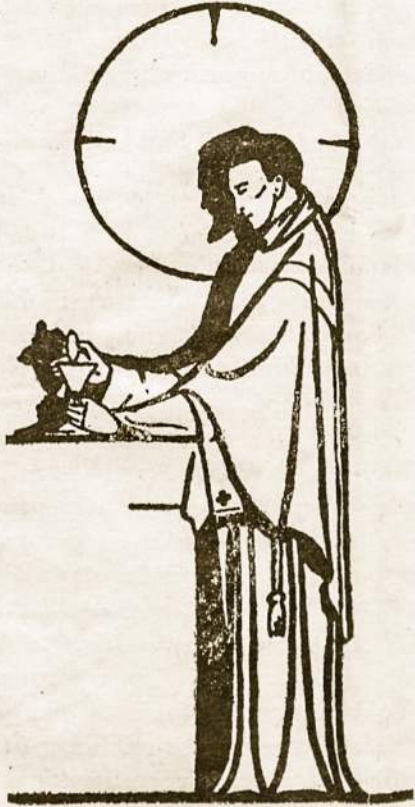
Sv. Komunija jungia visus katalikus meilės ir broliško ryšiu.

Kristaus atėjimas į mūsų planetą žemę, turi šį vienintelį tikslą, sujungti mus visus į vieną šeimą, kad priruošti mus dalyvauti savo dangiškojo Tėvo karalystėje.