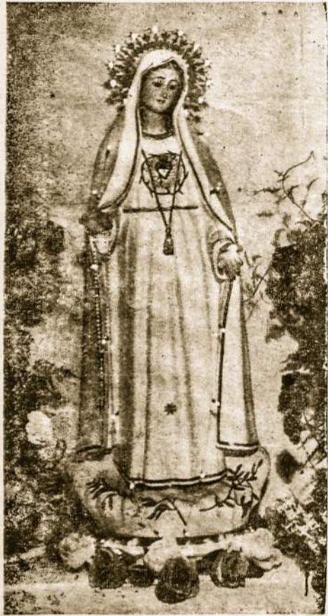
Fatimos Dievo Motina

Apokalipsės knygoje, 12 skyriuje skaitome šį vaizdą. "Ir pasirodė danguje didingas ženklas: moteris, apsiaustusi saule, po jos kojomis mėnulis, o ant galvos dvylikos žvaigždžių vainikas".