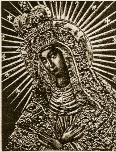
Aušros Vartų Marija, globok ir saugok Lietuvą!

Lietuva nuo pat krikščionybės įvedimo giliai suaugo su Marijos kultu. Marijos garbei buvo statomos šventovės, o kiekvienoje bažnyčioje jos garbei skiriami altoriai.