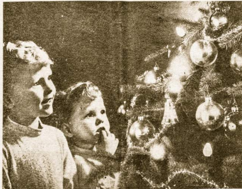
Mažųjų džiaugsmas prie Kalėdinės eglutės.

Pirmiausia — naikina fiziškai. Jo poveikyje gimsta fiziniai ir protiniai