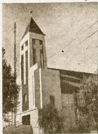
Montevideo Lietuvių bažnyčia kur vyks VI PALK pamaldos.

Brazilijoje, San Paulo mieste, 1965 m. vasario 18-21 dienomis. Šis kongresas pasižymėjo ypatingu svečių gausumu, atvykusių ne tik iš P. Amerikos kraštų, bet ir iš Š. Amerikos, Kanados ir Europos.