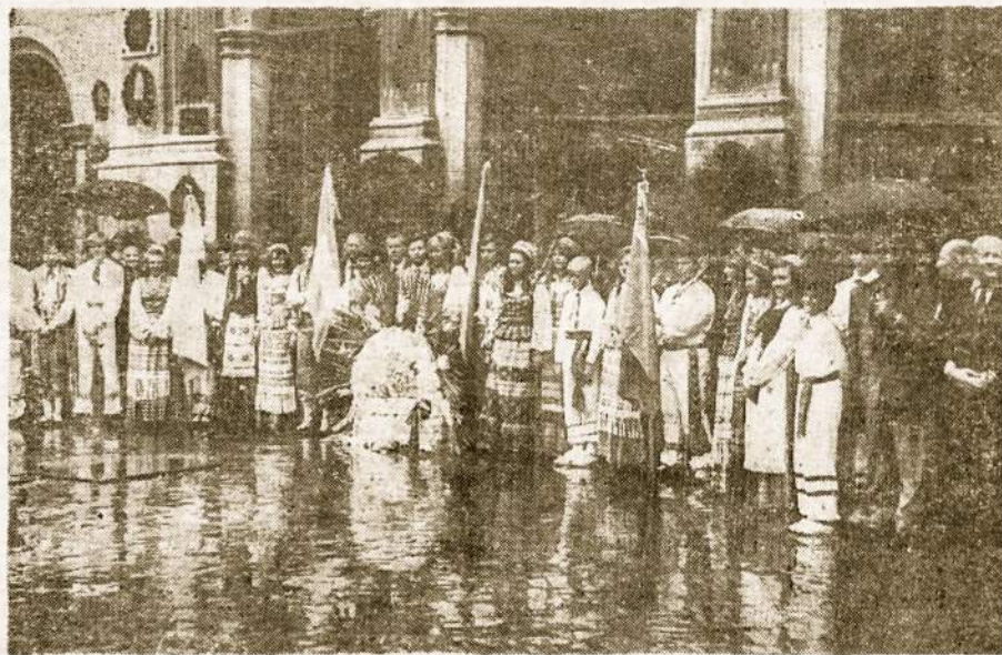
Po Mišių S. Domingo bažnyčioje, švenčiant Vasario 16 D. minėjimo antrąją dalį. Nuotraukoje: dalis jaunimo ir dalyvių su vainiku išėjus iš bažnyčios.

Po to sekė diplomų įteikimas tiems, kurie yra išgyvenę Argentinoje ne mažiau 50 metų. Diplomus įteikė Argentinos valdžia, atžymint 100 meto imigracijos įstatymo paskelbimo sukaktį.