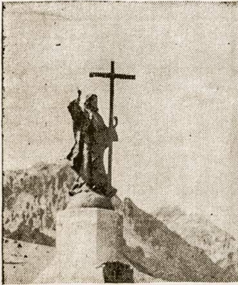
Kryžius - mūsų išganymo ženklės.

Šį kartą prisiminkime vieną Kristaus posakį, ištartą prieš pat mirtį: "Šian-