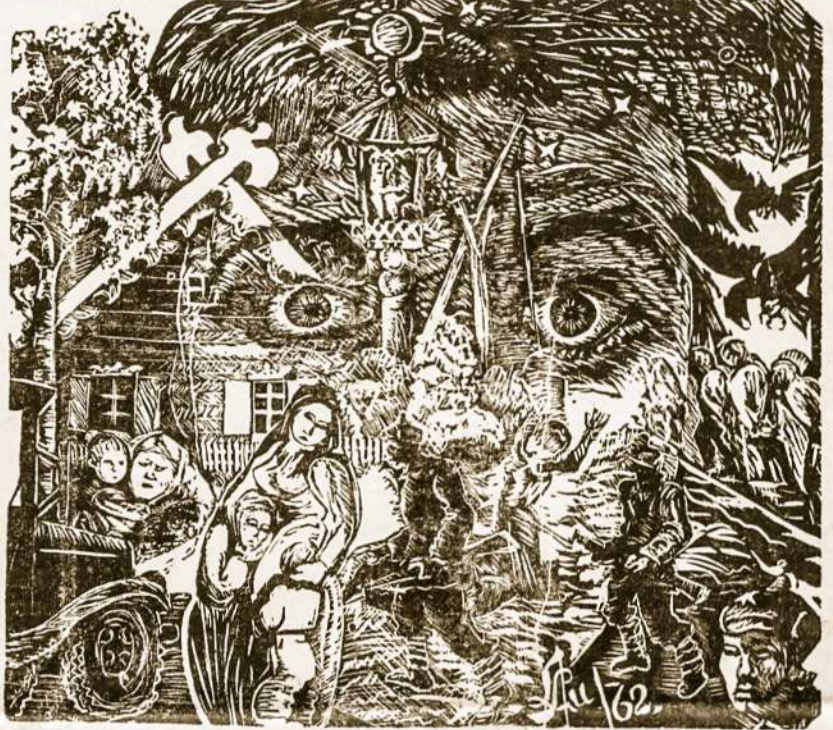
Birželio įvykių tragedija. Kun. A. Lubicko drožinys.