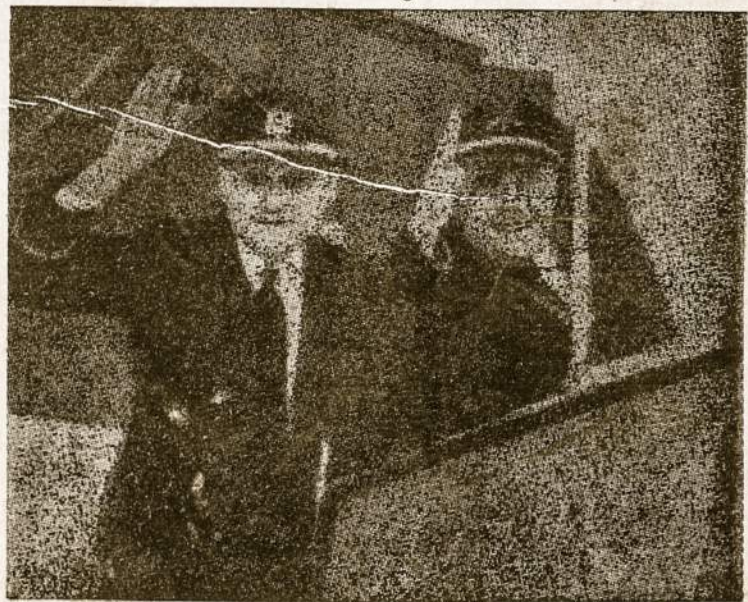
Darius ir Girėnas prie savo "LITUANIKOS". Jie perskrido Atlantą 1933 m. liepos 17 d. pavesdami savo žygį Jaunajai Lietuvai. Šiais metais sukanka 45 metai nuo jų garbingos mirties

Argentinos komandos laimėjimas sukėlė visoje tautoje tokį didelį entuziazmą, kad tuojau pat visos miestų gatvės užsipildė žmonių miniomis, kurios šaukė: "Argentina, Argentina" plėvėsuojant vėliavom. Atrodė, kad visa tauta laimėjo kokį svarbų mūšį.