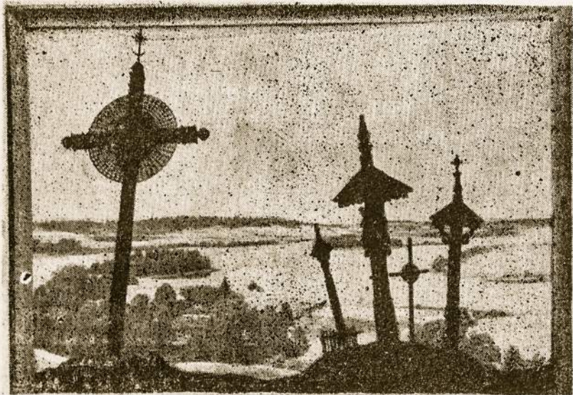
Lietuva kryžių ir kankinių tauta, niekada nenugalima kada nors bus vėl laisva!

“Dievas yra mūsų prieglauda ir stiprybė, veikiausia pagalba varguose...”. Kai kitos tautos pamiršo pavergtą mū-