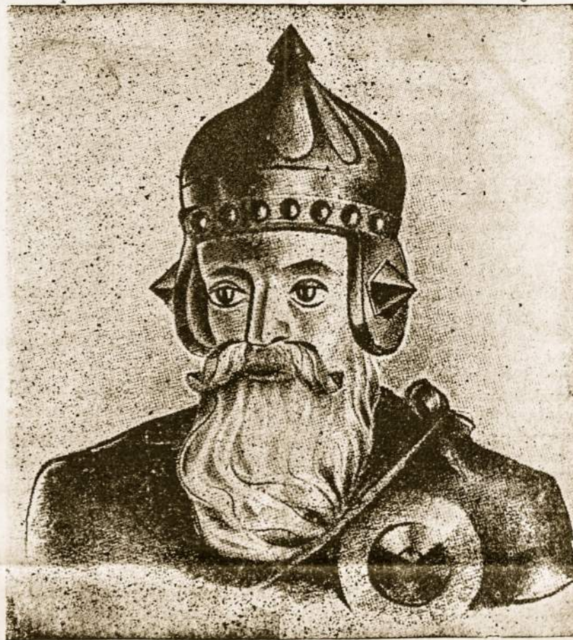
Lietuvos valdovas Mindaugas (1236-1263) pirmas jos Karalius, vainikuotas 1253 metais.

vardas paminėtas 1009 m. Tas rodo, kad lietuvių apgyventa žemė turėjo jau aiškias sienas. 1219 m. Lietuvos kunigaikščiai sudarė sutartį su Volinija. Lietuvai atstovavo 21 kunigaikštis. Jų tarpe buvo penki vyresnieji, kuriems