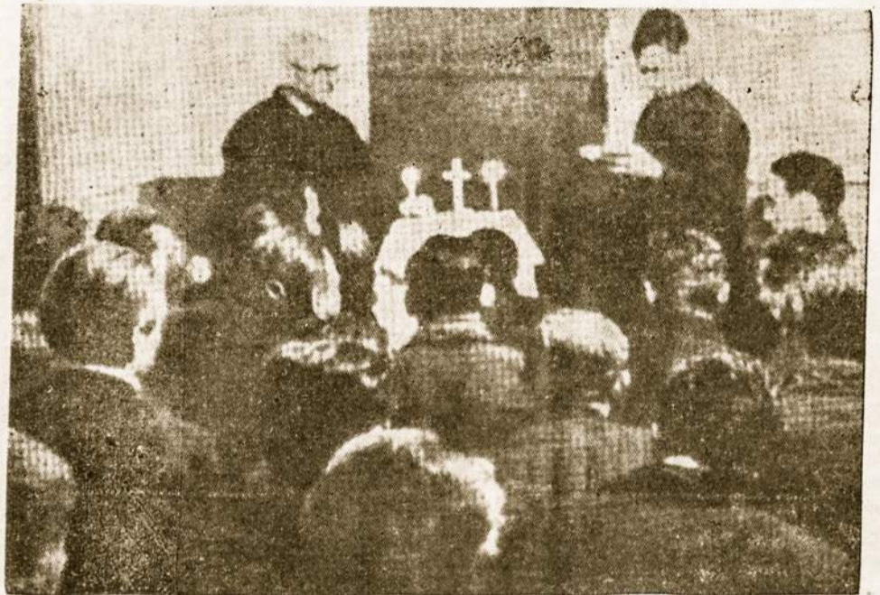
Slaptos pamaldos viename Sibiro vergų lageryje.