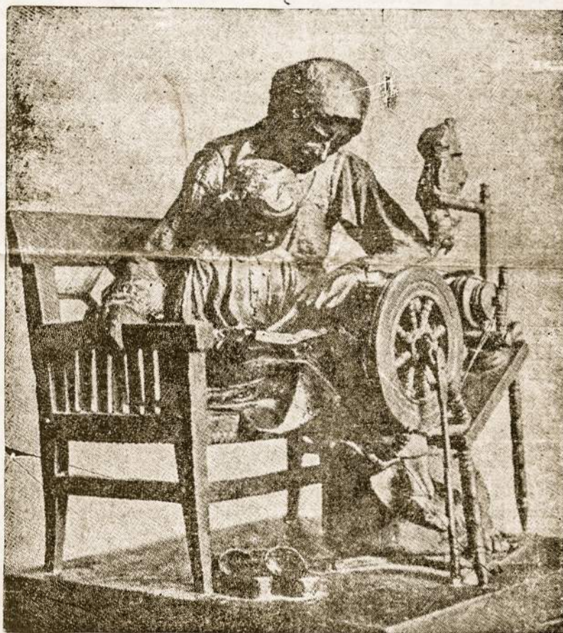
Vargu mokykla — simbolinė skulptūra, vaizduojanti spaudos draudimo laikotarpį, kai lietuvė moteris mokino lietuviško rašto savo vaikus prie ratelio, tuo išgelbedama lietuvių kalbą.

Bet istorija kartojasi. Pasikartojė ir rusiškoji okupacija tik šį kartą ne caristinė, bet komunistinė. Tas pats lie-