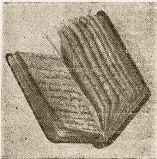
Sibiro tremtinių mergaičių ranka rašyta maldaknygė — "Marija, Gelbėk mus". Tai lietuvių kančios ir skausmo dokumentas. Ji yra išversta į anglų, vokiečių, olandų, italų, ispanų, portugalų, prancūzų, kinų ir kitas kalbas.

Avellaneda — prie lietuviško kryžiaus, 1979 m. rugsėjo 9 d.