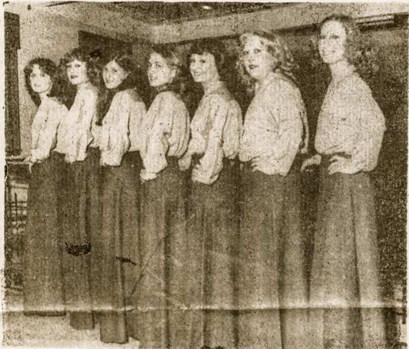
S.L.A. Pavasario šventėje "Žibutės" atlieka programą. Jos taip pat dainuos S.L.A. koncerte 20.X.79 ir bažnytiniame koncerte lietuvių parap. bažnyčioje šių metų lapkričio 25 d. "Žibučių" dainu vienetą yra pakviestas dainuoti į JAV ir Kanadą.

Mūsų atstovai kongrese dalyvavo labai aktyviai priklausydami darbo būreliams stovykloje, bei dalyvaudami įvairiose svarstybose studijų dienose.