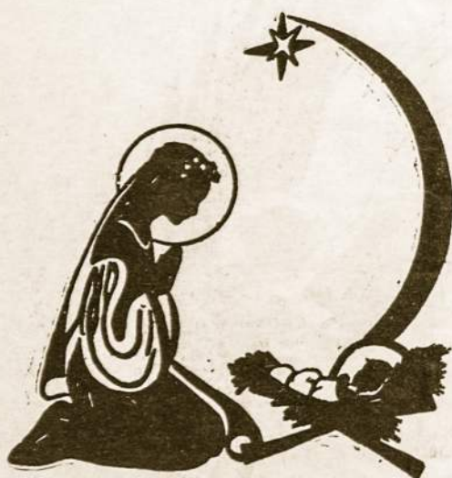
Sveikas Jėzau gimusis, Šventas Dievo Kūdikis!

Geros sveikatos rezultatai yra: didausmas, noras dirbti ir gyventi. Geros valios rezultatai yra: entuziasmas, artimo meilė, atvirumas ir sielos ramybė.