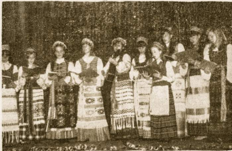
A. Lietuvių Centro naujai susitvėręs jaunų mergaičių — choras. Dabar į jį įsijungė ir bernikai sudarydami mišrų chorą. Choras pasirodė per Motinos dienos minėjimą L. Centre ir lietuvių parapijoje.

Antroje meno dalyje Lietuvių Centro jaunimas, naujoji "INKARO" karta gyvai pašoko: Blezdinginį Jonkelį, Gyvatarą ir Ma-