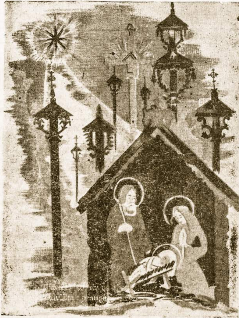
Lietuviška prakartėlė su savo charakteringais tautiniais bruožais: lietuviška apranga ir kryžistulpių fonas.