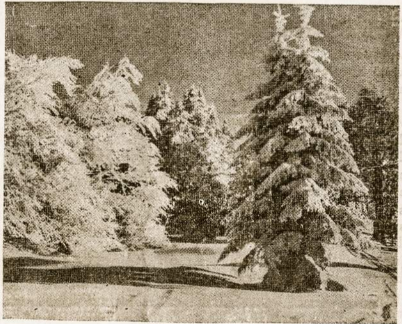
Kalėdinė gamta Lietuvoje.

Sveikindami su šv. Kalėdomis kviečiame atvykti į Bernelių Mišias gruodžio 24 d. 21 val. Prieš tai įvyks Gyvos Prakartėlės vaidinimas (atliks parapijos jaunimas).