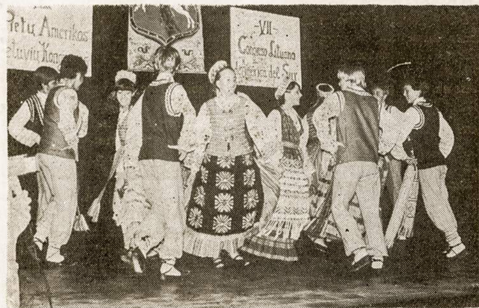
Arg. Lietuvių Centro ansamblis "Inkaras" atlieka programą per Vasario 16 d. minėjimą Buenos Aires miesto centre.