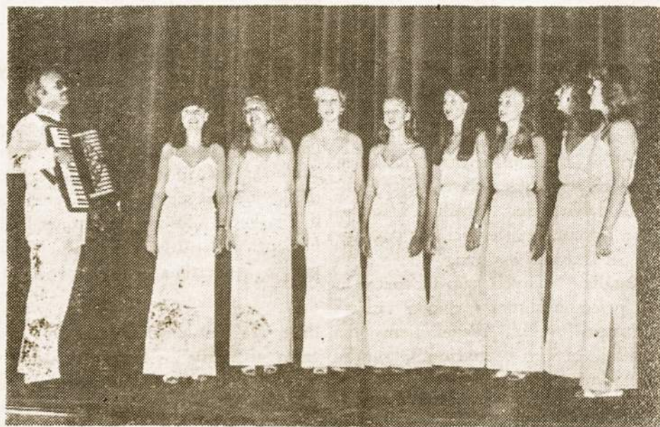
SLA dainų vienetas "ŽIBUTĖS" atlieka programą kongreso metu Buenos Aires centro salėje.

Pasibaigus oficialiai atidarymo daliai prasidėjo vaišės, susipažinimas su svečiais ir bendri pokalbiai.