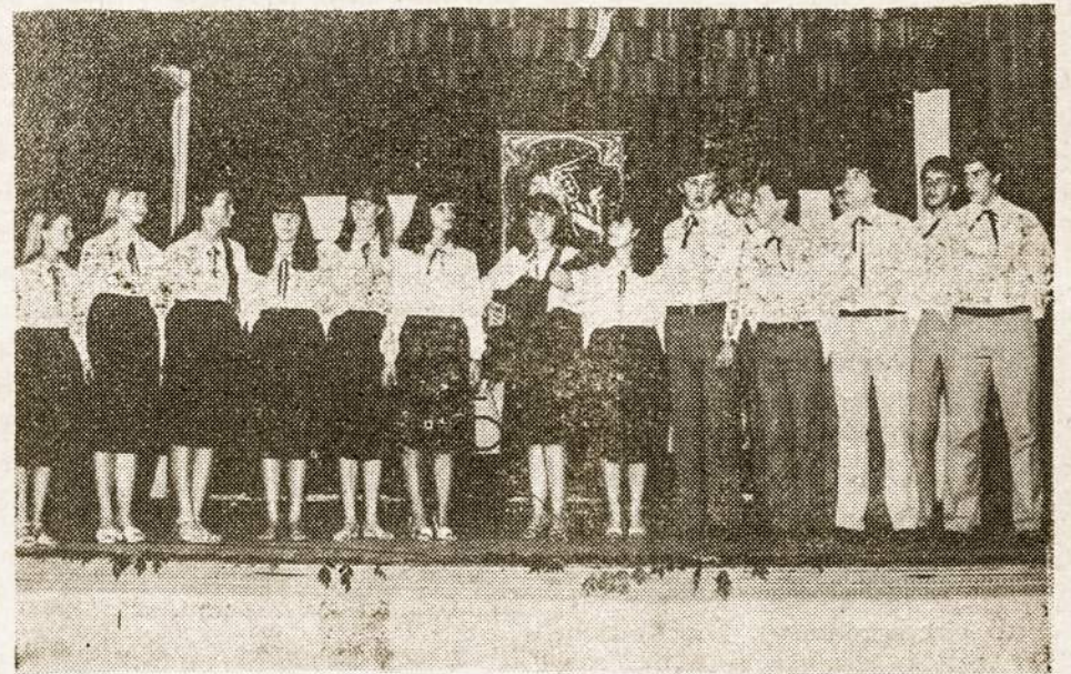
A. Lietuvių Centro jaunųjų choras atlieka programą per jaunimo vakarą L. Centro salėje.

• Popiežius Jonas Povilas II prieš Kalėdas išleido savo antrąją encikliką "Dives in Misericordia". Joje nurodoma, kad visuomenė galinti tapti žmoniškesnė, jei tarpusavio santykius remis ne vien teisingumu, bet ir gailingumu. Praktiškai ši enciklika yra pirmosios enciklikos "Redemptor Hominis" tęsinys.