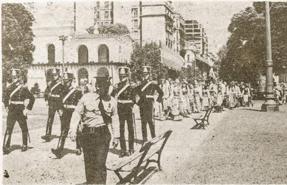
Lietuviai išeina iš katedros per Vasario 16 d. minėjimą. Prišaky eina garbės sargyba - granadieriai, už jų jaunimas, vainikas ir visi lietuviai. Eina per Pl. de Mayo ir artinasi prie Piramidės paminklo.

minėjo 30 metų sukaktį. Ši gimnazija yra lietuviškas švietimo židinys už Lietuvos sienų.