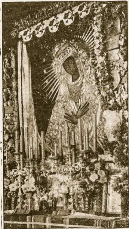
Aušros Vartų Marijos altorius lietuvių parap. bažnyčioje.

Marija yra mūsų visų dvasinė Motina, kuri taip pat ruošia naują krik-