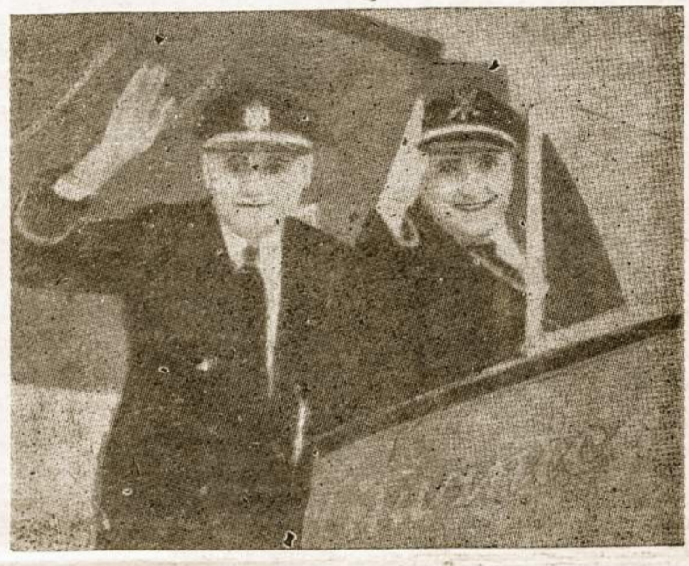
Darius ir Girėnas prie savo "Lituanikos" prieš perskrendant Atlantą 1933 m.

riaus ir Girėno žuvimo vietas ir pagerbia žuvusius. Žuvimo vietoje Lietuvos vyriausybė pastatė paminklą. Šiuo metu Lenkijos lietuviai renka pinigus, kad šį paminklą atnaujinti,