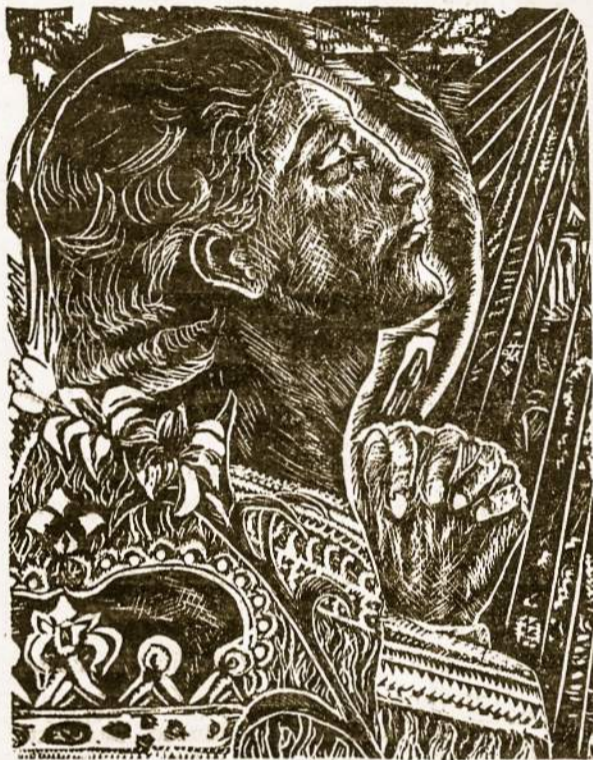
Šv. Kazimieras, atsisakęs karališkos garbės, mirė 1484 m. kovo mėn. 4 d. Gardine. 1948 m. Pop. Pijus XII paskelbė Lietuvos jaunimo globėju. Šv. Kazimieras šviečia savo evangelišku pavyzdžiu mūsų jaunimui Lietuvoje ir svetur. Prašykime šv. Kazimiero užtarymo mūsų Tėvynei Lietuvai, ypač mūsų jaunimui! Ruoškimės 500 metų jubilėjui, kurį švęsime 1984 metais.

siektų pažadėtus žemės krantus, kad būtų kartu pavyzdys kitoms tautoms. Kristus atėjęs žemėn, nepanaikino Mozei duotų įstatymų, bet stengėsi juos geriau išaiškinti ir papildyti, kad krikščionys visais amžiais turėtų prieš akis Dievo duotus įstatymus ir juos