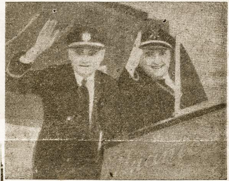
Lakūnai Steponas Darius ir Stasys Girėnas prie "LITUANIKOS" prieš žygį.

su tokiu mažu orlaiviu, koks buvo "Lituanika", buvo tikrai didvyrių žygis.