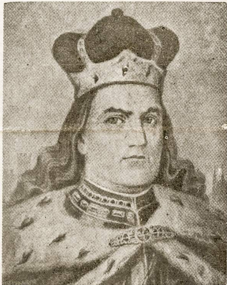
Vytautas Didysis - Lietuvos Kunigaikštis