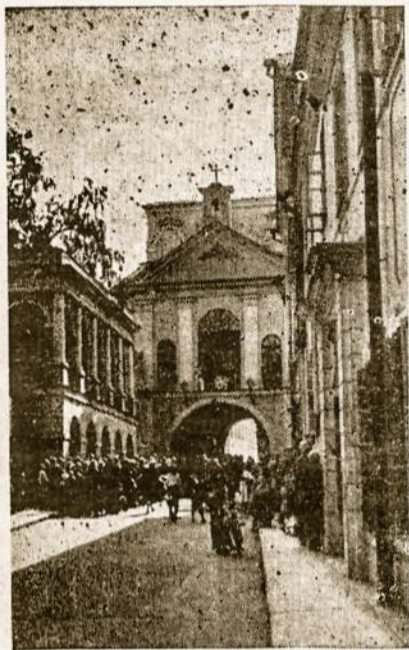
Aušros Vartai Vilniuje - Lietuvos šventovė.

Lietuviams laisvuose kraštuose turėtų būti nuolat primenama, kad jų broliai ir seserys Kristuje yra persekiojami bei diskriminuojami okup. Lie-