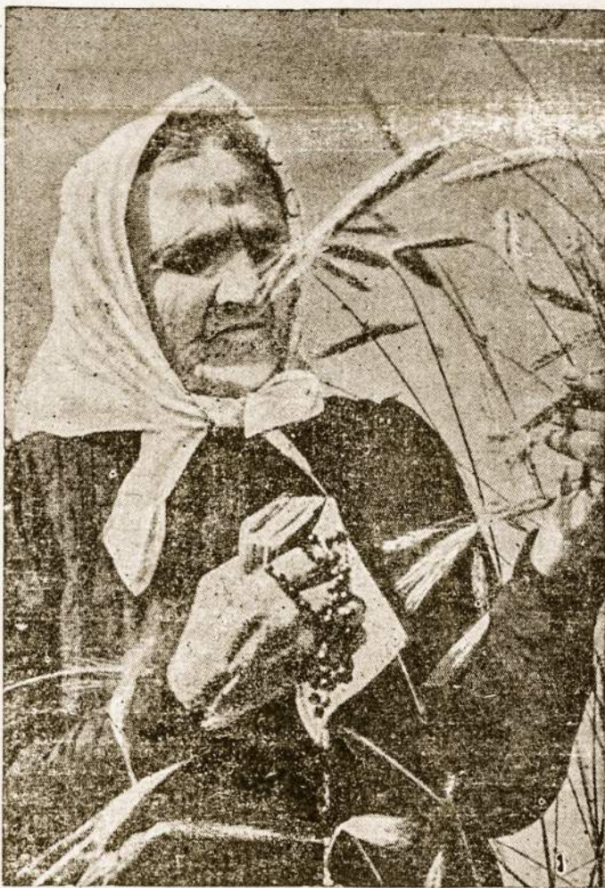
Nuotraukoje: lietuviška motina rugių lauke. Motinos Dienos proga sveikiname visas motinas Lietuvoje ir laisvame pasaulyje ir kviečiame atvykti į minėjimą liet. parapijon 1983 m. gegužės 15 d. (smulkiau skelbime pusl. 6).

Tai, Dieve mums padėk lietuviškame šeimos darbe!