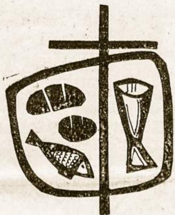
Pirmųjų krikščionių katakombinių Mišių simboliai.