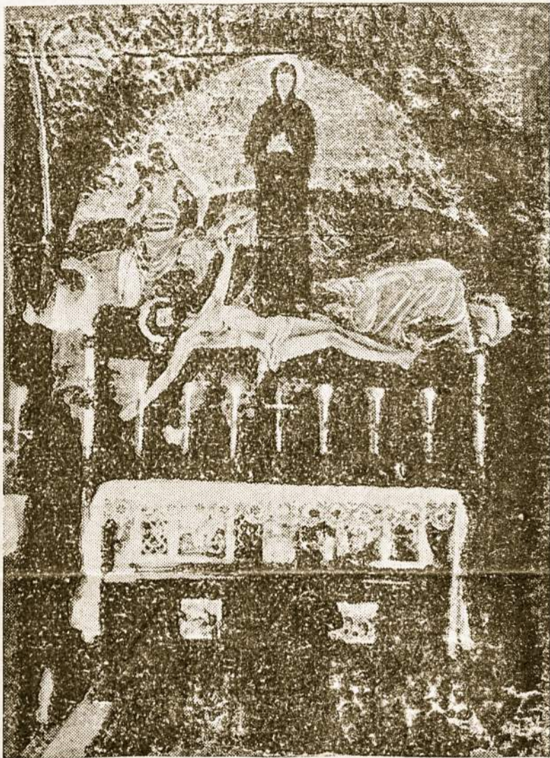
Alyvų Kalno bažnyčioje - Jėrusalėje - Dievo Motinos altorius.

Visa tai žinome iš katekizmo lapų, bet labai skirtinga yra ne tik žinoti, bet savo paties kojomis apvaikščioti