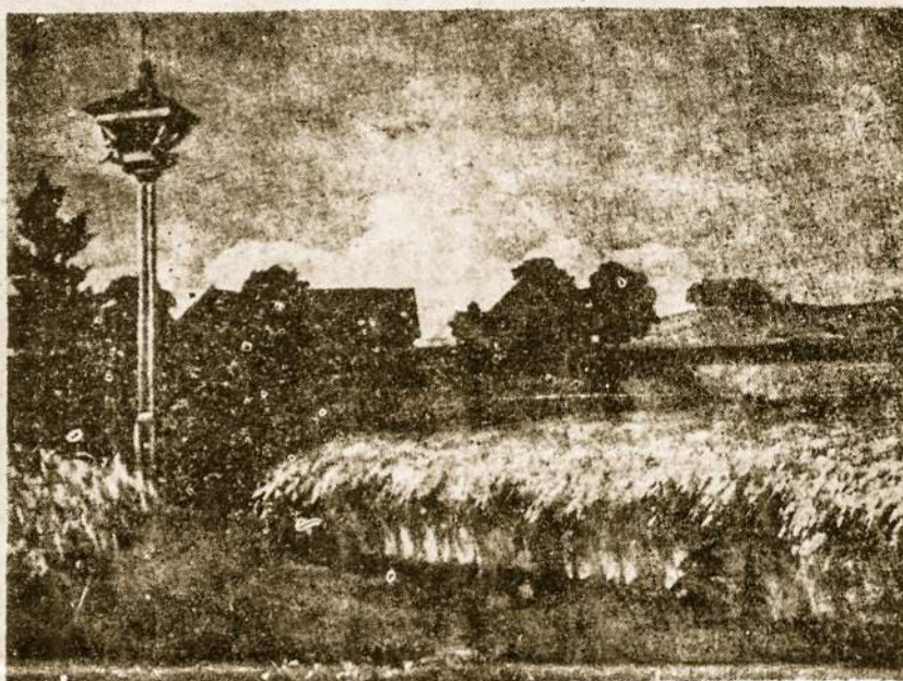
Siame dail. A. Rūkštelės kūrinyje matome neužmirštamą Lietuvos vaizdą: vienkiemis, rūgčių laukas ir kryžius.

Šiandieninė lietuvių dalis gal pati sunkiausia. Jo kova ir išverme stebisi visas pasaulis. Lietuvos vardas minimas visur ten, kur kalbama apie rezistenciją, smurtą ir prievartą. Pasaulį stebino partizanų kovos. Lietuvos Katalikų Bažnyčios kronika ir kiti leidiniai sukelia nuostabą. Visa lietuvių tauta yra pasipriešinimo stovyje.