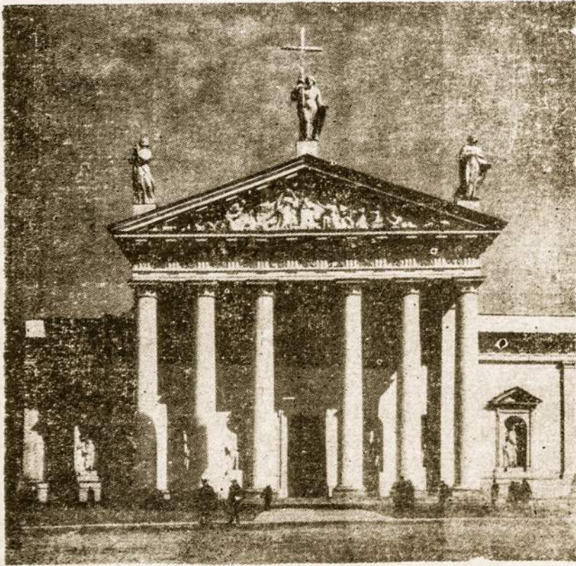
Vilniaus katedra, kur virš 400 metų ilsėjosi šv. Kazimiero palaikai, specialioje šv. Kazimiero koplyčioje. Dabar katedra paversta meno muziejumi.

Komisija peržiūrėjo šv. Kazimiero atminimui paruoštą medalio projektą, jį priėmė ir tikisi po poros mėnesių jį nukalti. Taip pat ruošama šv. Kazimiero knygelė su paveikslėliu ir maldomis. Neužilgo turėtų atspausinti ir 1984 metų kunigų kalendorių žinyną. Atskiram šv. Kazimiero paveikslėliu