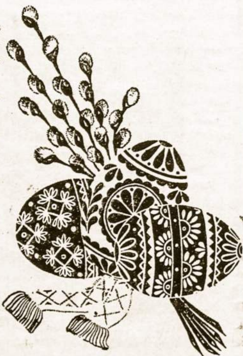
Velykų margučiai - mūsų tautos puošmena.

Laukinnės tautos kiaušinį naudo davo kabalistinėse savo apeigose, siek damos juo atsikratyti piktųjų dvasių. Be to, kiaušiniu gydė ir įvairias fizines bei socialines ligas. Prieš piktosios dvasios apsėsto žmogaus veidą burti ninkas vedžiodavo kiaušinį. Vėliau