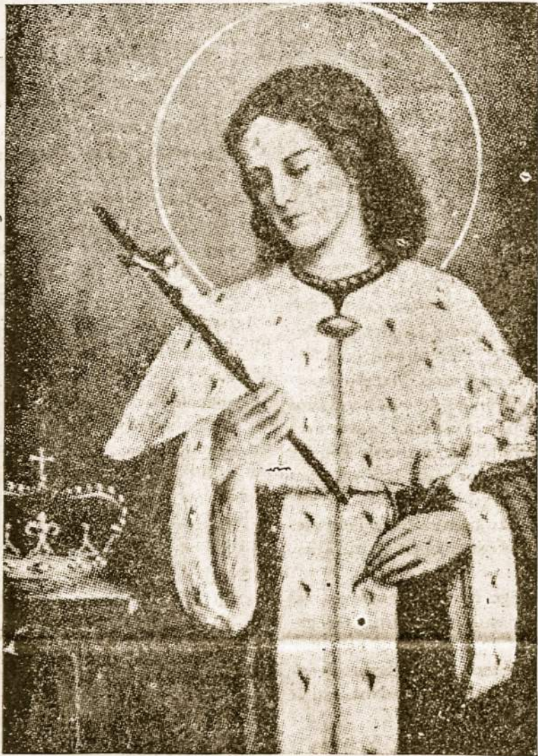
Šventas Kazimierai, globok lietuvių tautą!