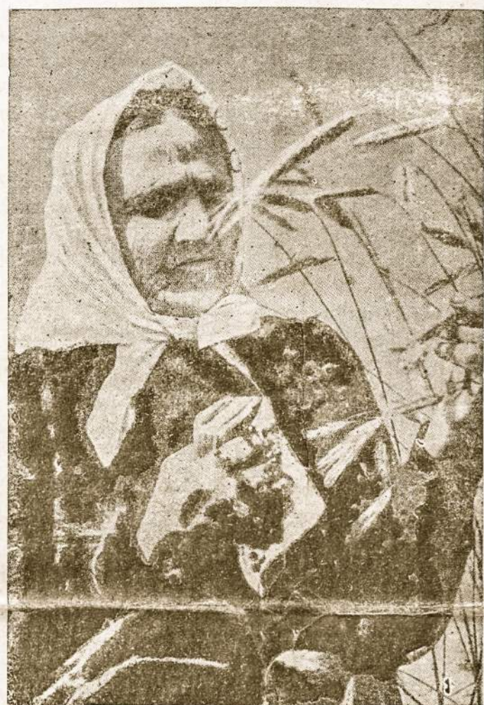
Nuotraukoje: lietuvė motina rugių lauke. Motinos Dienos proga sveikiname visas motinas Lietuvoje ir laisvame pasaulyje ir kviečiame atvykti į minėjimą liet. parapijon 1984 m. gegužės 13 d. (smulkiau skelbime pusl. 6)

Argentinios prezidentas dr. Raul Alfonsin buvo nuvykęs į Argentinios pietus, kur lankėsi Beagle kanale, sąryšy su derybomis su Čile.