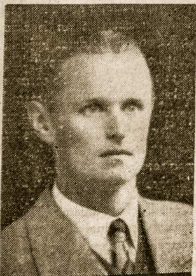
Prieš metus laiko, 1983 m. spalio mėn.