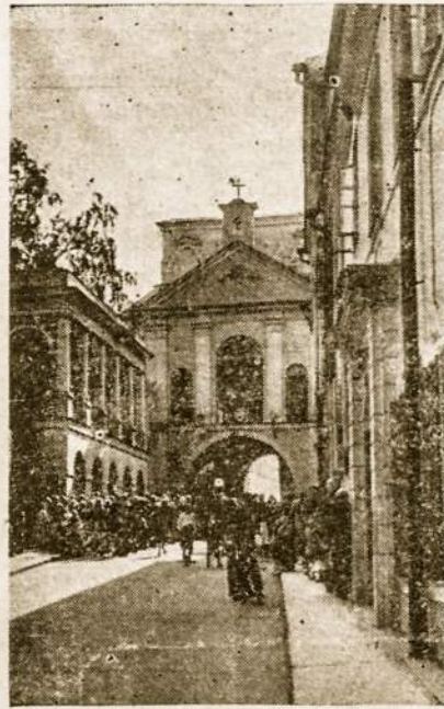
Aušros Vartai Vilniuje

Seinų "Aušra" kreipiasi į užjūrio lietuvius, kviesdama visus ją prenu