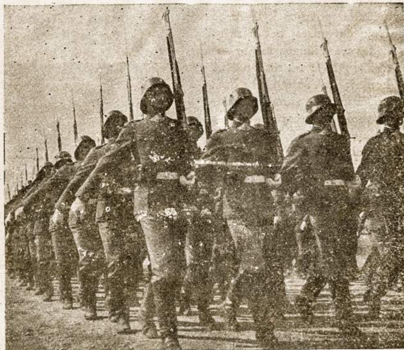
Lapkričio 23 d. Lietuvos Kariuomenės diena. Ji buvo visuomet minima Lietuvoje: iškilmingomis pamaldomis, kariuomenės parada, kuri priimdavo valstyb. prezidentas ir ministrai. Ta proga - sveikiname visus buvusius Lietuvos kariuomenės karius Argentinoje!