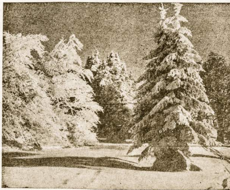
Ziema Lietuvoje - Kalėdose