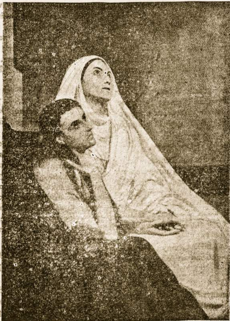
Sv. Augustinas su savo motina Sv. Monika Augustinas mus moko ieškoti didžiausio turto - Dievo ir dėl jo paaukoti visa.