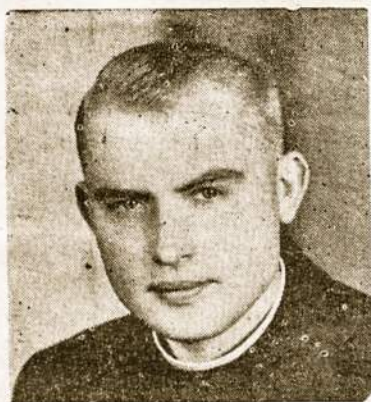
KUN. AUG. STEIGVILAS, MIC.

Šie pirmieji pasiruošimo metai yra "GEROS NAUJIENOS METAI".