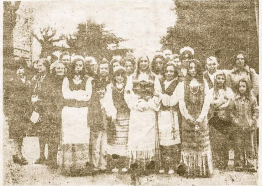
Birutietės ir jaunosios birutietės laukia Jūsų malonaus atsilankymo į jų 55-rių metų meane šventę, kuri įvyks lapkričio 30 d. 12 - 13 val., c. Jorge 330 - Adroque.

davo daug publikos, nes čia vyravo šeimin'ska nuotaika. Vėliau su kitais drauge, organizuoja lietuviams argentinų kalbos kursus viniems ir taip pat organizuoja lietuvių kalbos - kitiems. Rengia bendras Kūčias visur ir visada palaikydamos lietuviškus papročius. Tenka pažymėti, kad Birutės d-ja pradėjo pirmoji ruošti Motinos Dienos m'nėjimus. Dar savų patalpų neturėdamos samdo sales, bet publikos niekad netrūksta. Stegiant lietuvišką