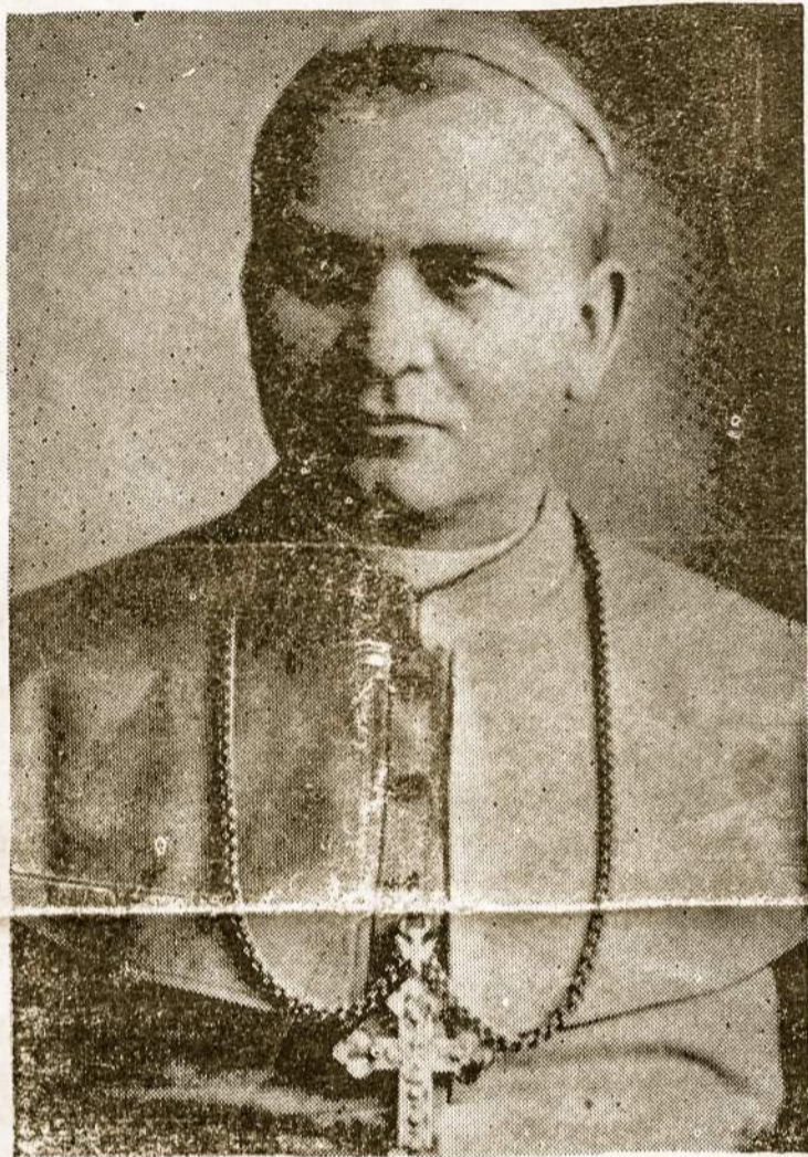
Palaimintasis arkivyskupas Jurgis Matulaitis

Prieš 60 metų sausio 27 d. uždegėm vašką žvakę prie gestančios arkivyskupo Matulaičio gyvybės, o šiais metais birželio 28 d. uždegame altoriuje ir savo širdy jo naujos gyvybės žvaigždę, kad ji degtų mums paguoda ir padrąsinimu šių dienų įtampos šėšėliuose.