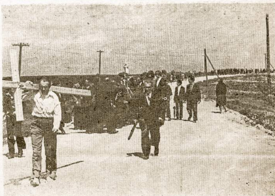
Iš Sibiro grįžęs kunigas neša procesijoje padėkos kryžių į Kryžių kalną 1979 m. liepos 22 d.

Romoje vyksta vyskupų sinodas, kuriame dalyvauja viso pasaulio vyskupų konferencijų atstovai, vienuolynų vyresnieji, bei pasauliečių sąjudžių atstovai. Sinodo pagrindinė tema yra