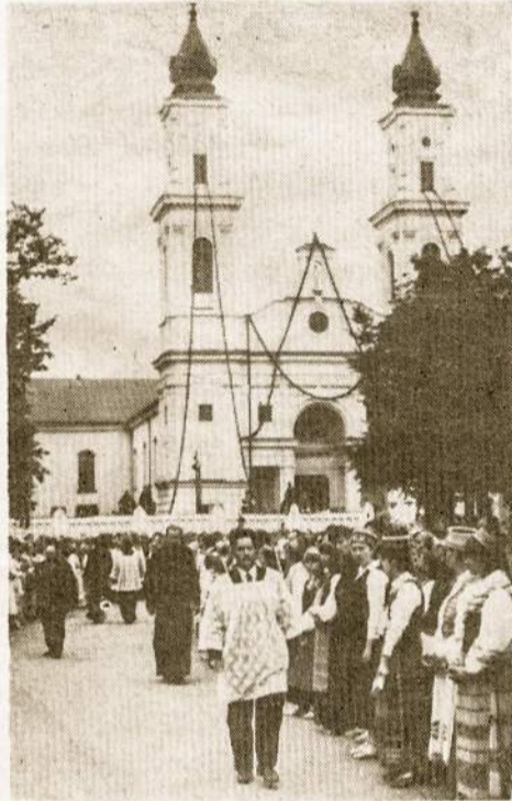
Marijampolės bažnyčia liepos 12 d.