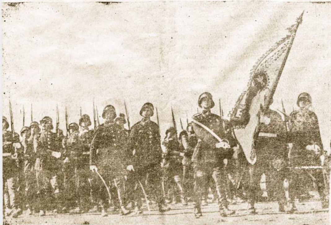
Saunioji Lietuvos kariuomenė, kuri paties vyriausio kariuomenės vado abgaulūgai buvo sunaikinta.